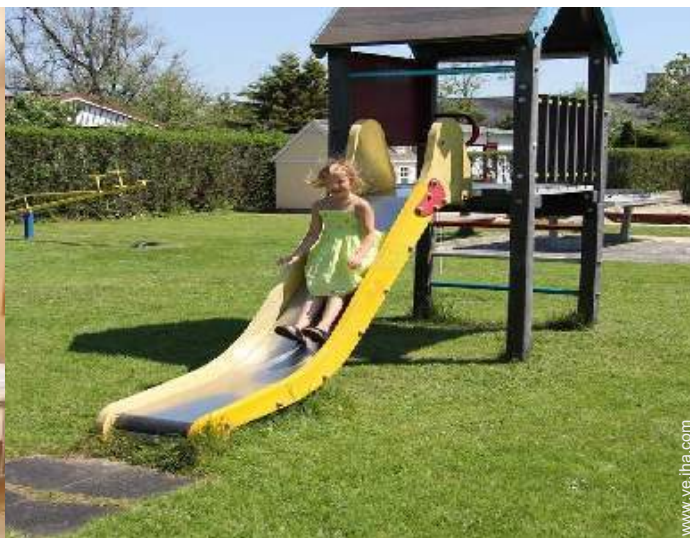
instalación de ocio