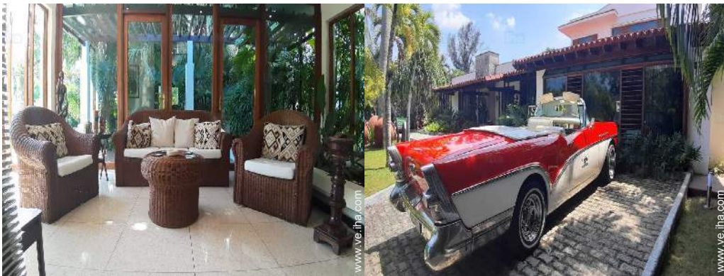
vista desde el salón