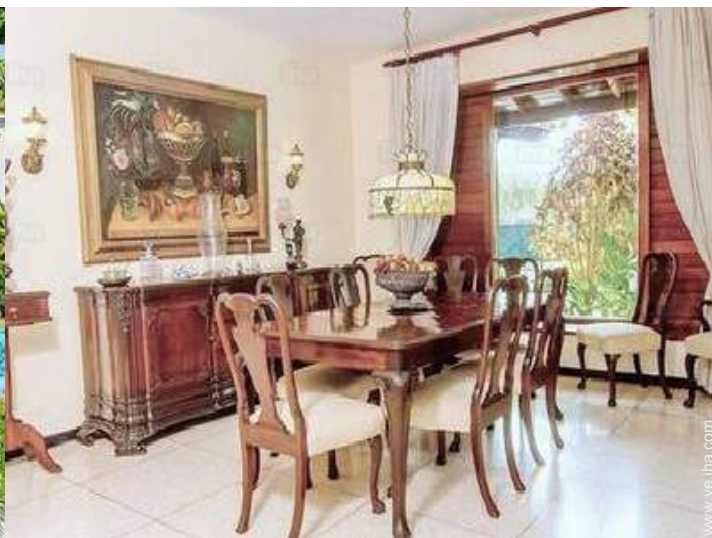
vista desde le comedor