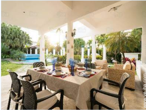
vista desde el jardín/parque