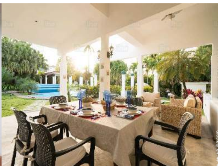
vista desde el jardin/parque