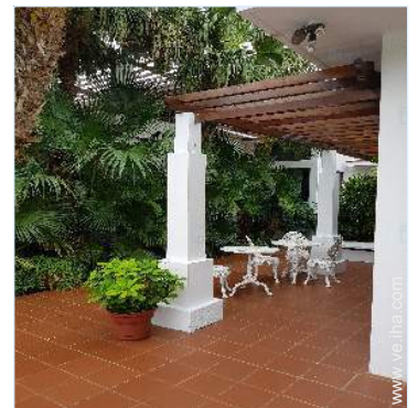
vista desde el patio