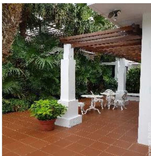
vista desde el patio