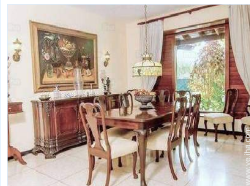
vista desde le comedor