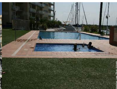
instalación de ocio