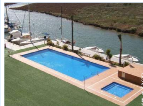
Instalación exterior a disposición de los huéspedes