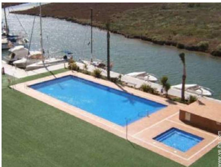
Instalación exterior a disposición de los huéspedes