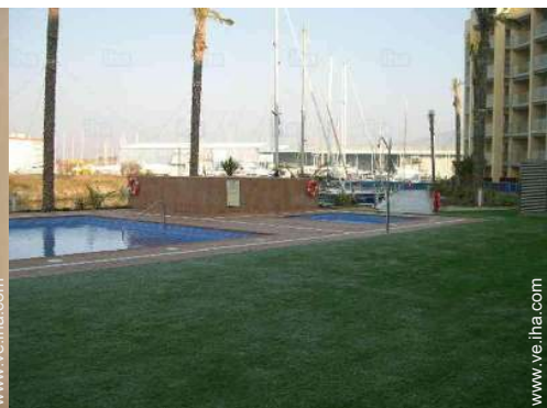
vista sobre el puerto