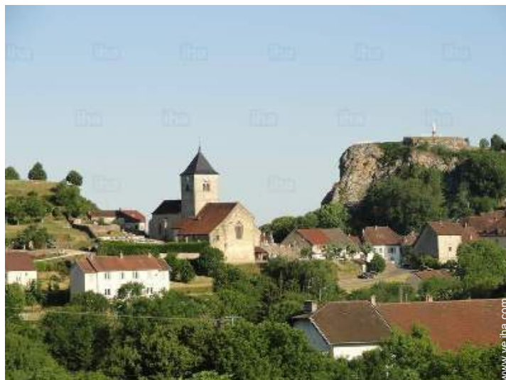
centro del pueblo