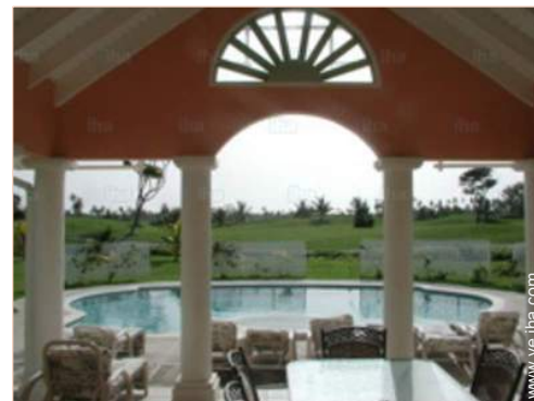
vista desde el patio

Parrilla a gas, mesa(s) de jardin, 8 silla(s) de jardín, 8 reposera(s)