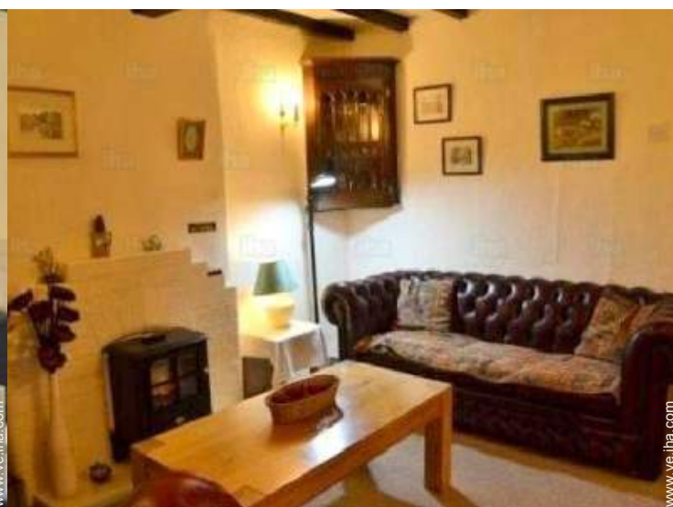
habitación de servicio