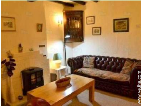
habitación de servicio